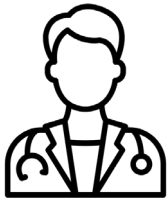
Pr Benyamina Psychiatre et addictologue